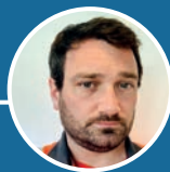
Gabriel VALERA DOP STOCKAGE