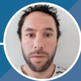
Xavier MIRANDE DOP STOCKAGE